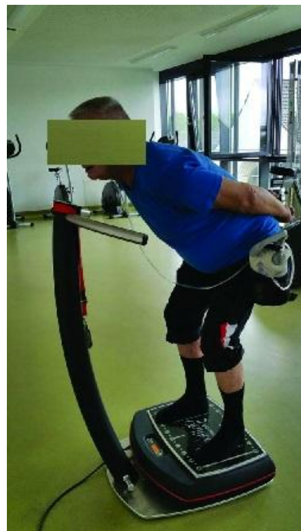
شکل ۱. نحوه قرارگیری آزمودنی روی صفحه دستگاه ویریشن در حین اجرای حرکت "اسکات با زانوی کمی خم"

آزمون رساندن دستها به نوک انگشتان پاها در حالت نشسته: برای اندازه گیری انعطاف عضلات خلفی اندام تحتانی از این آزمون استفاده شد که از پیچیدگی پایینی برخوردار بوده و آزمون مناسبی برای سالمندان می باشد. از فرد خواسته می شد یک نفس عمیق بکشد و تنه خود را خم کند و با آرنج صاف، دست هایش را (برای جلوگیری از چرخش تنه روی هم بگذارد) به سمت نوک انگشتان اندام تحتانی مورد آزمون تا حداکثر دامنه مفصل به جلو ببرد. اندام تحتانی مورد بررسی در کل زمان اجرای آزمون باید صاف باشد. میزان انعطاف توسط خط کش به سانتیمتر اندازه گیری گردید. بیشترین میزان انعطاف هر اندام در سه تلاش به عنوان رکورد فرد ثبت گردید (۱۹).