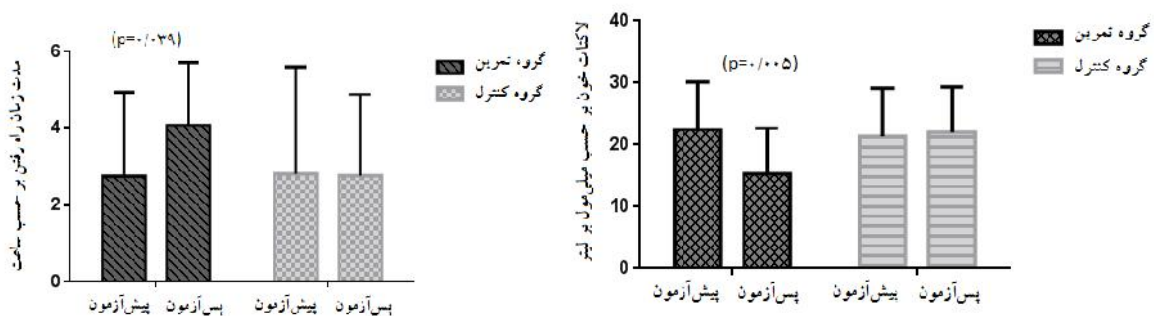
تصویر ۲. مقایسه پیش‌آزمون و پس‌آزمون برای لاکتات خون

نتایج تی همبسته نشان داد که در شاخص‌های خستگی مدت‌زمان راه رفتن و لاکتات خون در گروه تمرین بین پیش‌آزمون و پس‌آزمون اختلاف معناداری وجود دارد که مقدار احتمال آن‌ها به ترتیب (p=0.039) و (p=0.005) بود (جدول ۳).