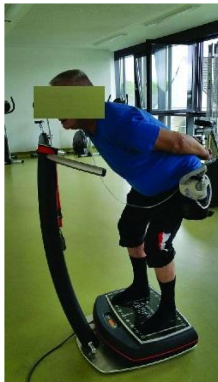
شکل ۱. نحوه قرارگیری آزمودنی روی صفحه دستگاه ویریشن در حین اجرای حرکت "اسکات با زانوی کمی خم"

آزمون رساندن دستها به نوک انگشتان پاها در حالت نشسته: برای اندازه گیری انعطاف عضلات خلفی اندام تحتانی از این آزمون استفاده شد که از پیچیدگی پایینی برخوردار بوده و آزمون مناسبی برای سالمندان می باشد. از فرد خواسته می شد یک نفس عمیق بکشد و تنه خود را خم کند و با آرنج صاف، دست هایش را (برای جلوگیری از چرخش تنه روی هم بگذارد) به سمت نوک انگشتان اندام تحتانی مورد آزمون تا حداکثر دامنه مفصل به جلو ببرد. اندام تحتانی مورد بررسی در کل زمان اجرای آزمون باید صاف باشد. میزان انعطاف توسط خط کش به سانتیمتر اندازه گیری گردید. بیشترین میزان انعطاف هر اندام در سه تلاش به عنوان رکورد فرد ثبت گردید (۱۹).